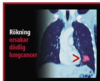
En av bilderna i EUs bildbibliotek – på svenska.

Det är nu ett stort antal länder som avvisat tobaksindustrins protester och hot om legala åtgärder och med hjälp av nya eller skärpta tobakslagar infört varningsbilder. I de flesta fall har