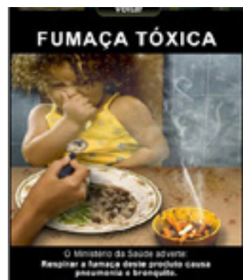
Röken är giftig. Brasilien.