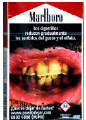
Varningsbilderna i Uruguay täcker 80 procent av båda sidor.