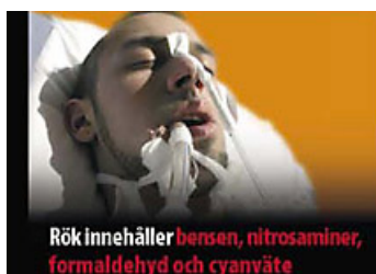
Varning på svenska för nitrosaminer, formaldehyd och cyanväte i cigarettroken.