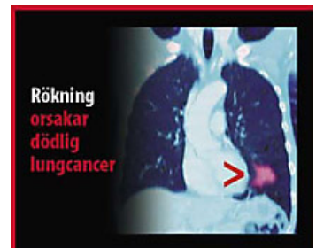
En av bilderna i EUs bildbibliotek – på svenska.

Det är nu ett stort antal länder som avvisat tobaksindustrins protester och hot om legala åtgärder och med hjälp av nya eller skärpta tobakslagar infört varningsbilder. I de flesta fall har det kunnat ske utan att något tobaksbolag försökt att med rättsliga medel stoppa besluten. I de flesta fall där det förekommit har domstolarnas beslut alltid gått emot tobaksindustrin.