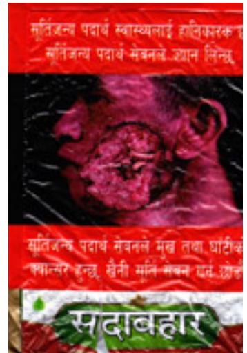
Nepal har störst varningar med 90 procent på båda sidor.

Box 738, 101 35 Stockholm, Klara Östra Kyrkogata 10, www.tobaksfakta.se