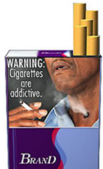
Mannen på en tilltänkt USA-bild är anonym.