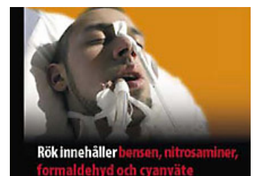
Varning på svenska för nitrosaminer, formaldehyd och cyanväte i cigarettroken.