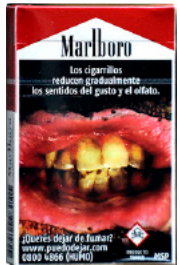
Varningsbilderna i Uruguay täcker 80 procent av båda sidor.