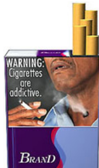
Mannen på en tilltänkt USA-bild är anonym.