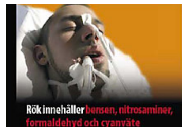
Varning på svenska för ni-trosaminer, formaldehyd och cyanväte i cigarettroken.