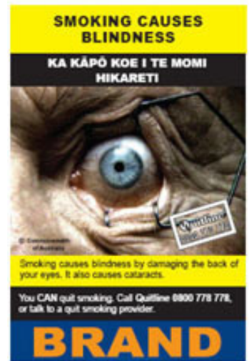
Rökning orsakar blindhet, bild från Nya Zeeland.

http://www.tobaccofreecenter.org/files/pdfs/en/WL_examples_en.pdf