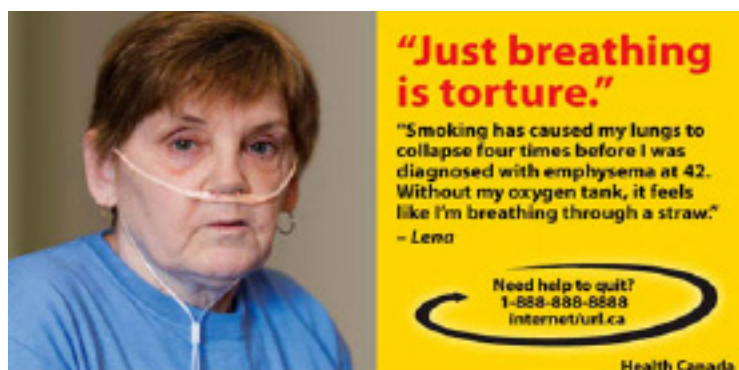
En kanadensisk varningsbild som visar en kvinna som insjuknat i lungemfysem av sin rökning. "Bara att andas är tortyr", säger hon.