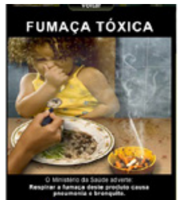
Röken är giftig. Brasilien.